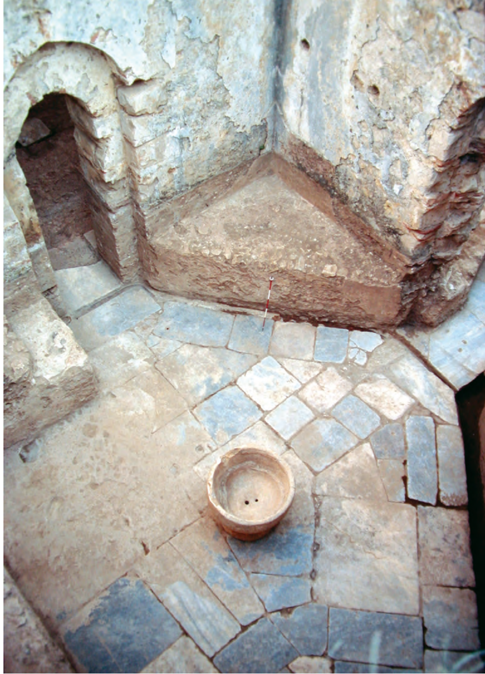
Büyük Hamam Ilıklık mekânı ve fiskiyeli havuzu.