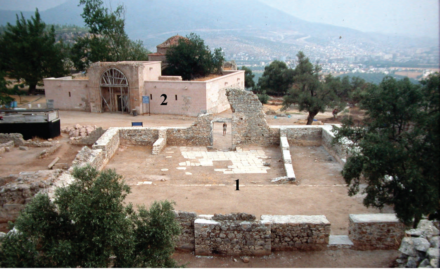
Orhan Camii ve Ahmed Gazi Medresesi Güneyden görünüş. 1- Orhan Camii 2- Ahmed Gazi Medresesi.

XVII. yüzyılın ilk çeyreği ortalarında, bir yangın sonucu tahrip olduğu anlaşılan Mültezim Evi'nin, XIV. yüzyılda inşa edilmiş olması muhtemel görünmektedir.