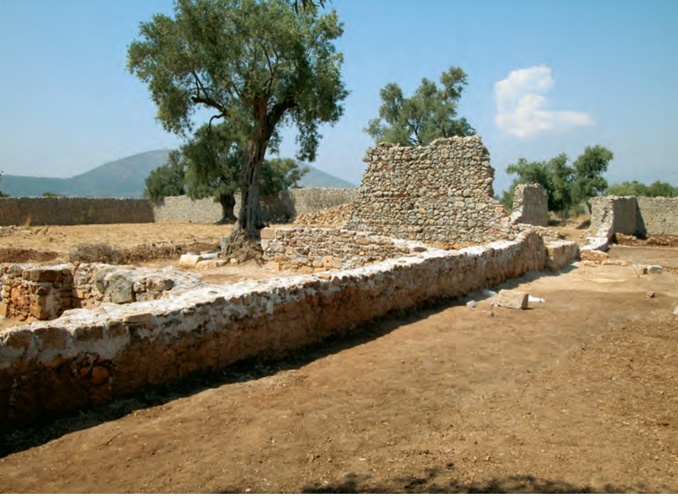
Emir Avlusu Mekanların güneyden görünüşü.