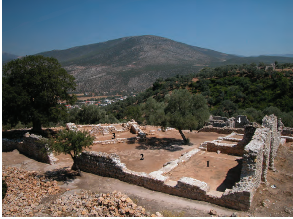
Seymenlik Zaviyesi Batıdan görünüş 1- Toplantı odası 2- Avlu 3- Mescit 4- Hamam